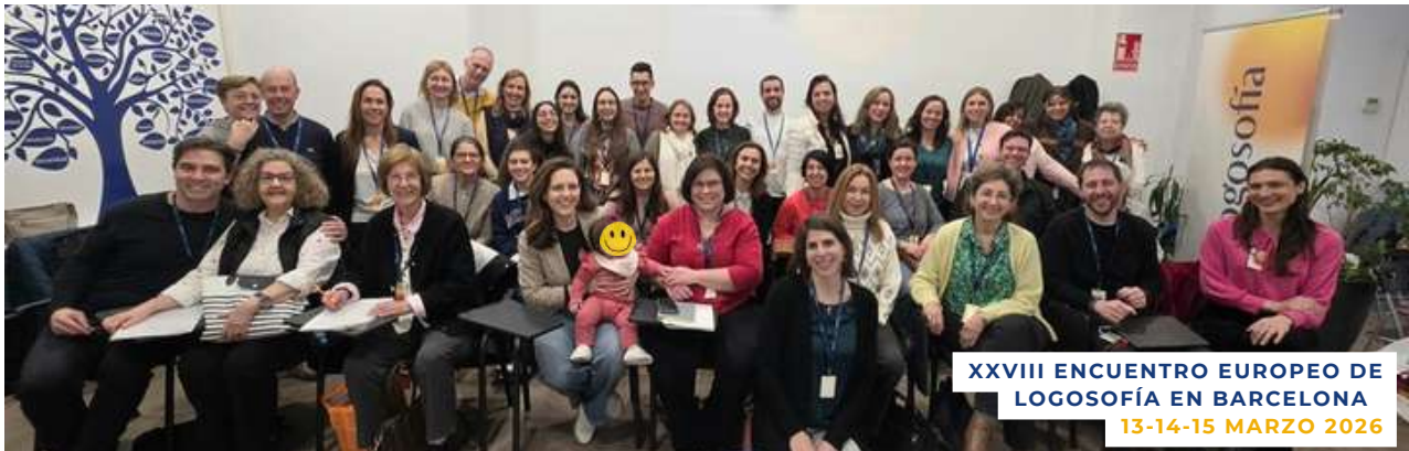
XXVIII ENCUENTRO EUROPEO DE LOGOSOFÍA EN BARCELONA 13-14-15 MARZO 2026

La Logosofía continúa generando espacios de reflexión, aprendizaje y convivencia en distintos lugares del mundo. En esta edición compartimos algunas de las actividades, encuentros y experiencias desarrolladas durante los últimos meses, mostrando cómo el interés por el conocimiento de sí mismo y la superación consciente sigue uniendo a personas de diferentes edades, culturas y países.